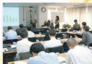
貿易部会・コンサルタント部会共催 の英語セミナー