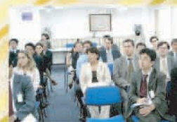
法律委員会の月例法律セミナー (2006年2月)