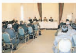
2005年下半期の 業種別部会長懇談会