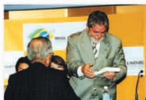
ルーラ大統領訪日時に田中 会頭がブラジル日本商工会 議所編纂の「現代ブラジル事 典」を贈呈(2005年5月)