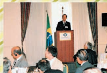
懇親昼食会で講演するルイス・フルラン通商開発相 (2006年2月)