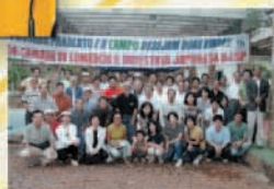
リオデジャネイロ日本商工会 議所との合同セラーズ見学旅行 (2003年3月)