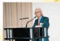
2006年新年昼食会で講演する 畑正憲氏(ムツゴロウさん)