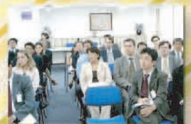
Seminário Mensal da Comissão Jurídica (fevereiro de 2006).