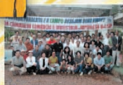
Visita de Estudos à região dos Cerrados, realização conjunta com a Câmara de Comércio e Indústria Japonesa do Rio de Janeiro (março de 2003).