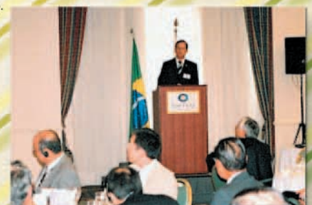
Ministro do Desenvolvimento, Luiz Furlan, em palestra durante o Almoço de Confraternização (fevereiro de 2006).